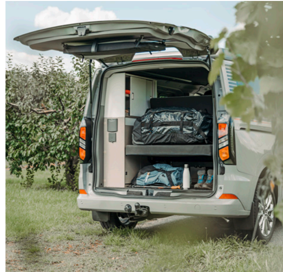
Der Heckbereich bietet eine große Ladefläche.