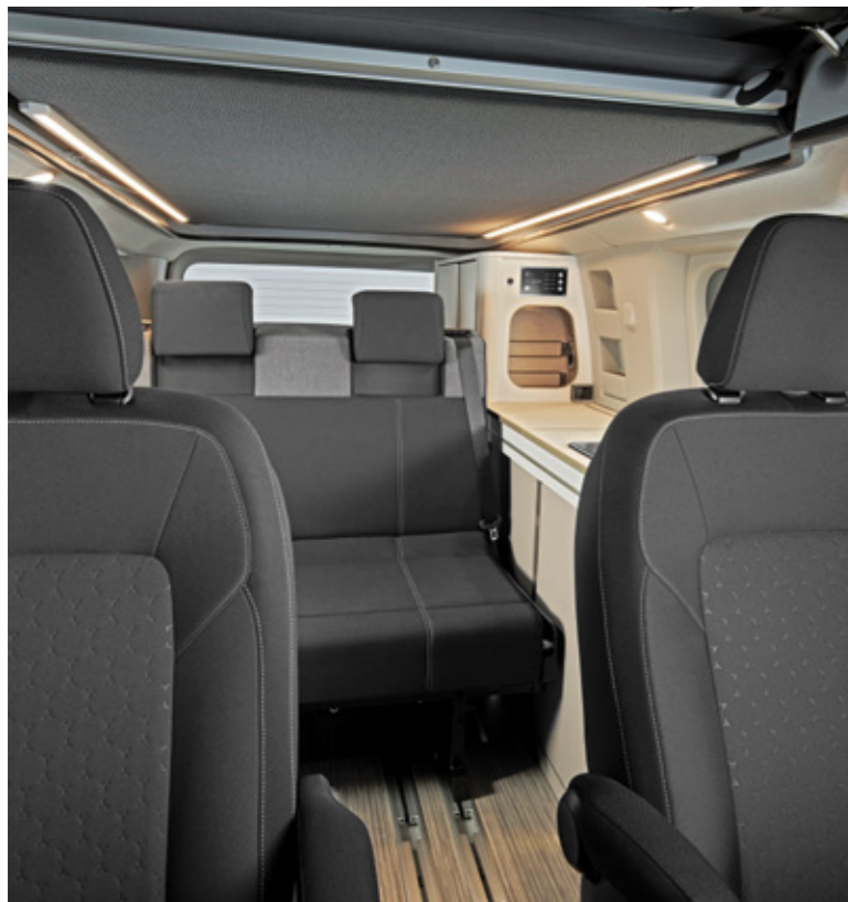
In der „Holiday Version“ wird der Copa C 500 durch eine hintere Sitzbank ergänzt, die zur Schlafcouch umgebaut werden kann (wie auf der obigen Abbildung). Wer sich für die „Bus Version“ entscheidet, erhält zwei Einzelsitze anstelle der Sitzbank im Heck. Im C 530 ist die Sitzbank bereits im Serienumfang enthalten.