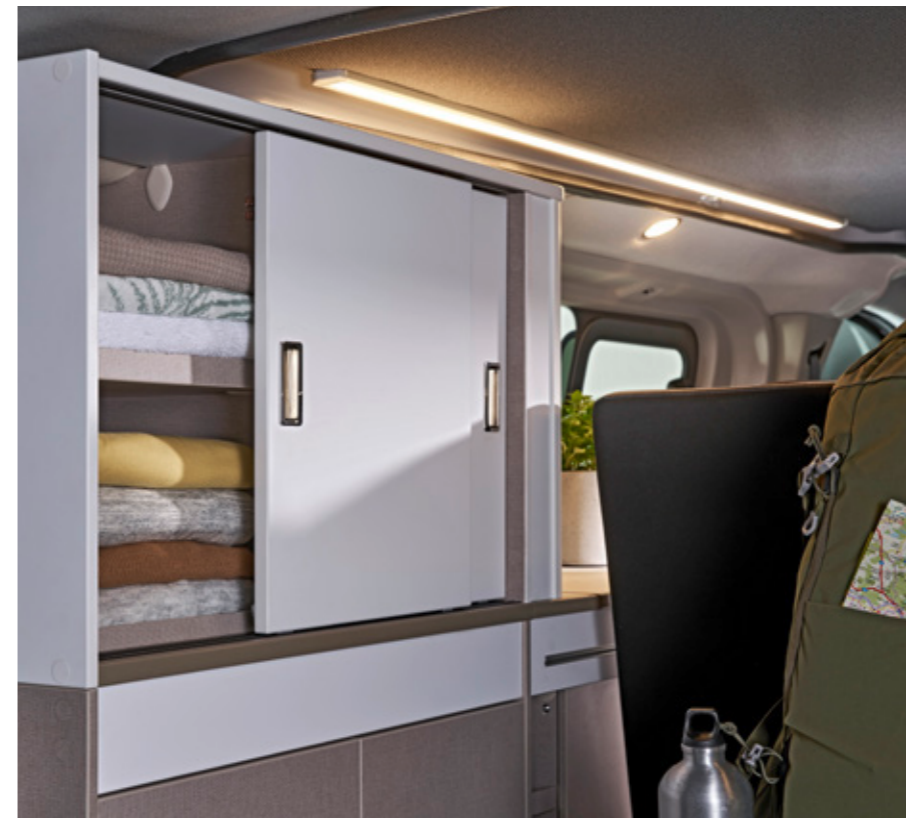
Zusätzlicher Stauraum für Kleidung oder was Sie sonst dabei haben wollen bietet der integrierte Schiebetürenschränk. (nur C500)