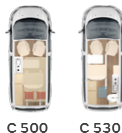
C 500 C 530

Angabe der Maximalwerte in dieser Baureihe.