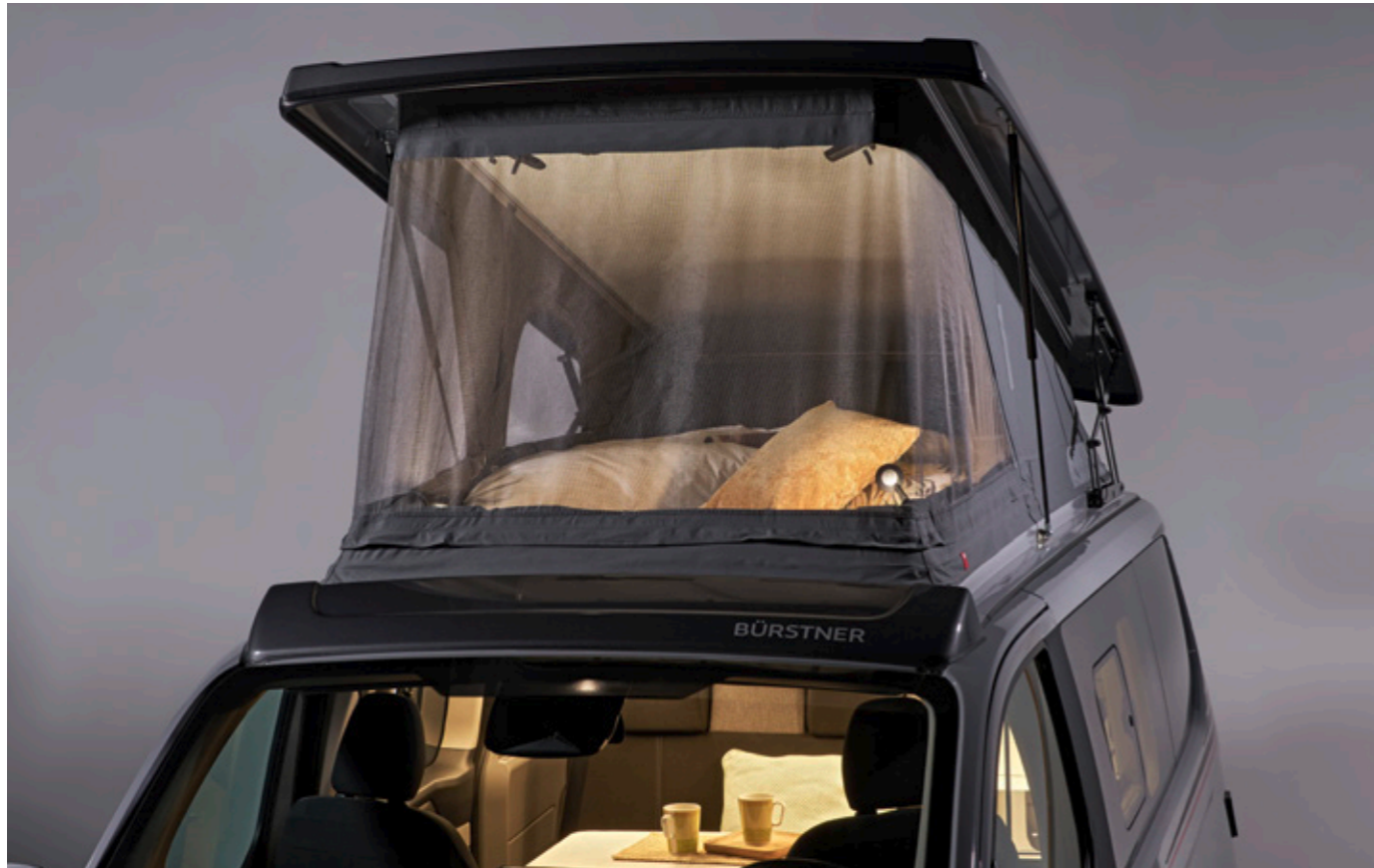
Serienmäßiges Schlafdach mit bequemem Doppelbett, integrierten Schwanenhalleuchten und Panoramafunktion mit Moskitonetz